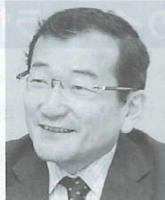
日本大学 危機管理学部 教授